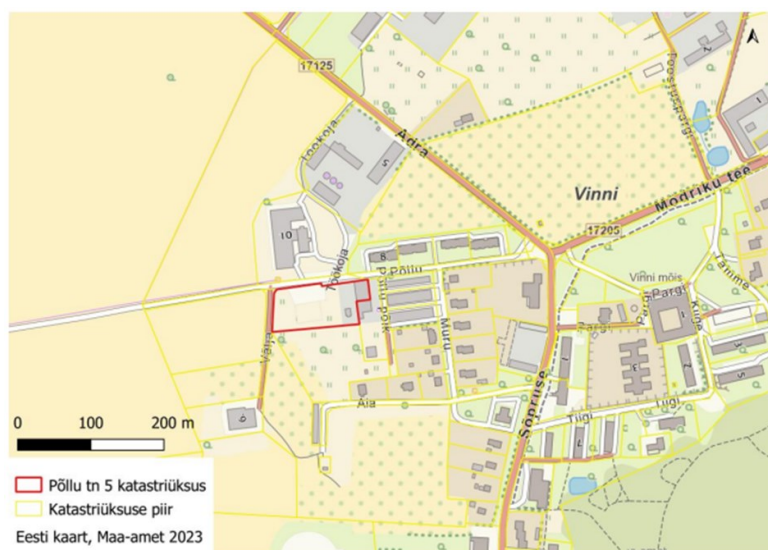
Joonis 1. Põllu tn 5 paiknemine.

Metsahake OÜ soovib muuta keskkonnavalua nr L.ÕV/326822, et võtta Lääne-Virumaal Vinni alevikus Põllu tn 5 kinnistul (katastritunnus 90002:002:0025; joonis 1) asuvas katlamajas kasutusele lisakütusena ohtlikke aineid sisaldavad puidujäätmed (purustatud raudteeliiprid) maksimaalselt 35% ulatuses. Taotluse kohaselt soovitakse põletada aastas kuni 1800 tonni hakkepuitu, sh mitteohtlikke puidujäätmeid (KMHs arvestatud maksimaalse kogusega 2340 t/a) ja kuni 600 tonni ohtlikke aineid sisaldavat puitu (KMHs arvestatud maksimaalse kogusega 780 t/a). Keskkonnaamet algatas kavandatavale tegevusele KMH 07.07.2022 kirjaga nr DM-118905-9 .